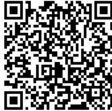
FB 千里台灣粉絲專頁